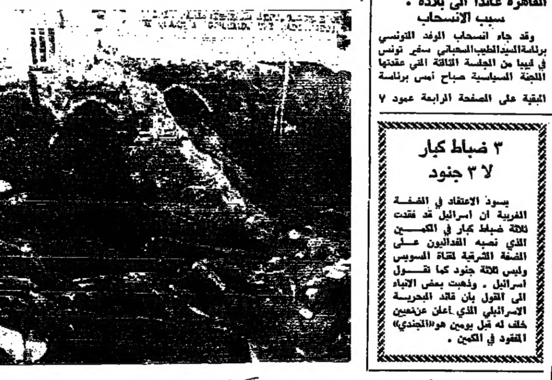
صورتان لاسكيتان للدستور من اليونانيات كاترين الارزل في ايران الى اليمن : كاترين جيسمة نسسي انفاش الخن والقري ، والى اليسار : في الوفا القتلى